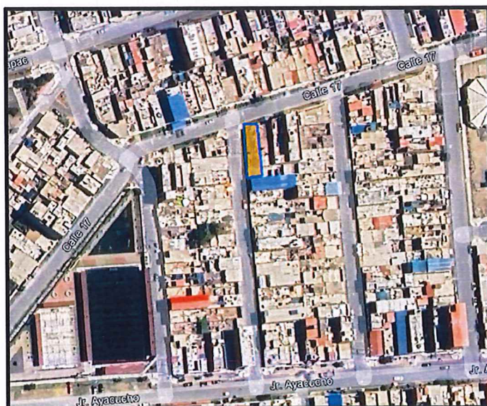
Figura 01. Ubicacion del Servicio de la Actividad.