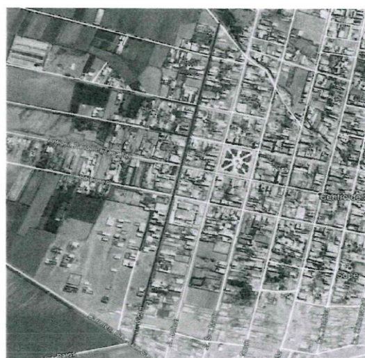
Zona de estudio. CALLES WIGHET, ESPINAR, BOLOGNESI, FRANCISCO VIDAL, ALFONSO UGARTE, PASAJE 1 Y 2