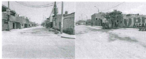
Situación actual de las calles de CALLES WIGHET, ESPINAR, BOLOGNESI, FRANCISCO VIDAL, ALFONSO UGARTE, PASAJE 1 Y 2

transitabilidad de los vehículos motorizados con relación al deterioro del patrimonio público y privado, los daños principalmente provienen del polvo que afecta a las personas y a sus bienes. La demanda proyectada es el tráfico existente sin haberse implementado el proyecto, el crecimiento del tráfico vehicular está dado en 1.3% (tasa de crecimiento poblacional) para vehículos de pasajero y de 2.5% para vehículos de carga (PBI agropecuario departamental). Además, cabe resaltar que, en las calles a intervenir no se ha detectado ningún impedimento (legal o técnico, como, por ejemplo: afectaciones de calles) para poder realizar la construcción de pistas y veredas que es el objetivo del presente estudio técnico.