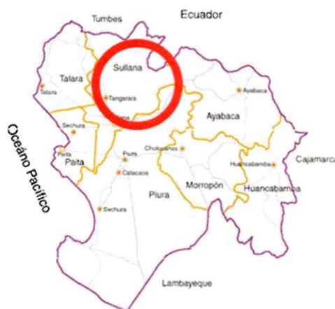
Figura N°01: Provincia de Sullana Mapa de ubicación