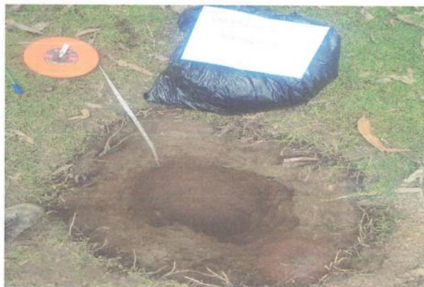
Imagen N° 02. Vista fotográfica de la toma de muestras