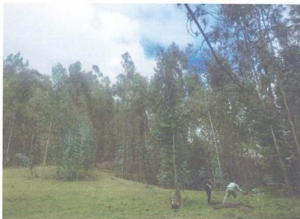
Imagen N° 01. Vista fotográfica panorámica del terreno.