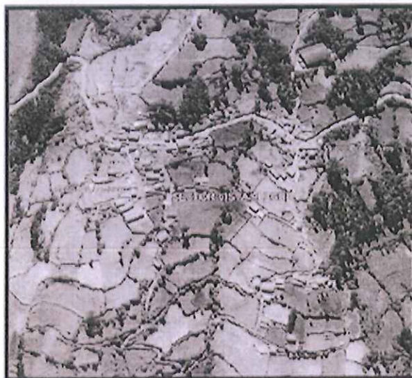
Lugar del proyecto. Google Maps.