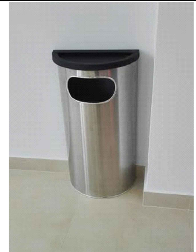
PAPELERA METALICA PARA EL HALL PUBLICO (Imagen referencial)