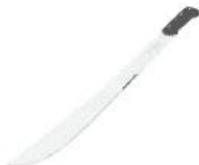
Figura 3. Machete tipo sable (imagen referencial).

Las herramientas manuales de uso agrícola se entregarán de manera unitaria. Por tanto, no requiere de empaque/embalaje.