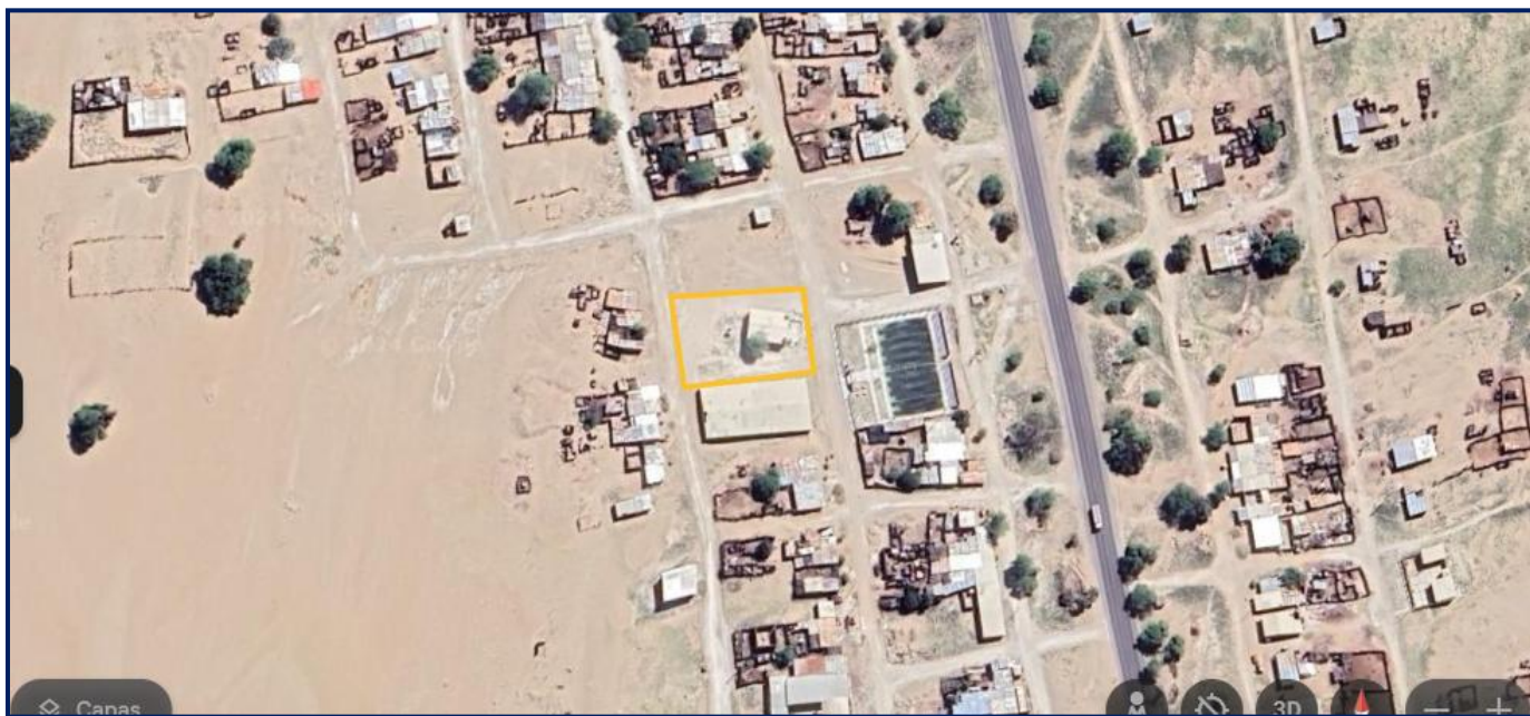
Ilustración 3: ZONA A INTERVENIR – REFERENCIA MALA VIDA