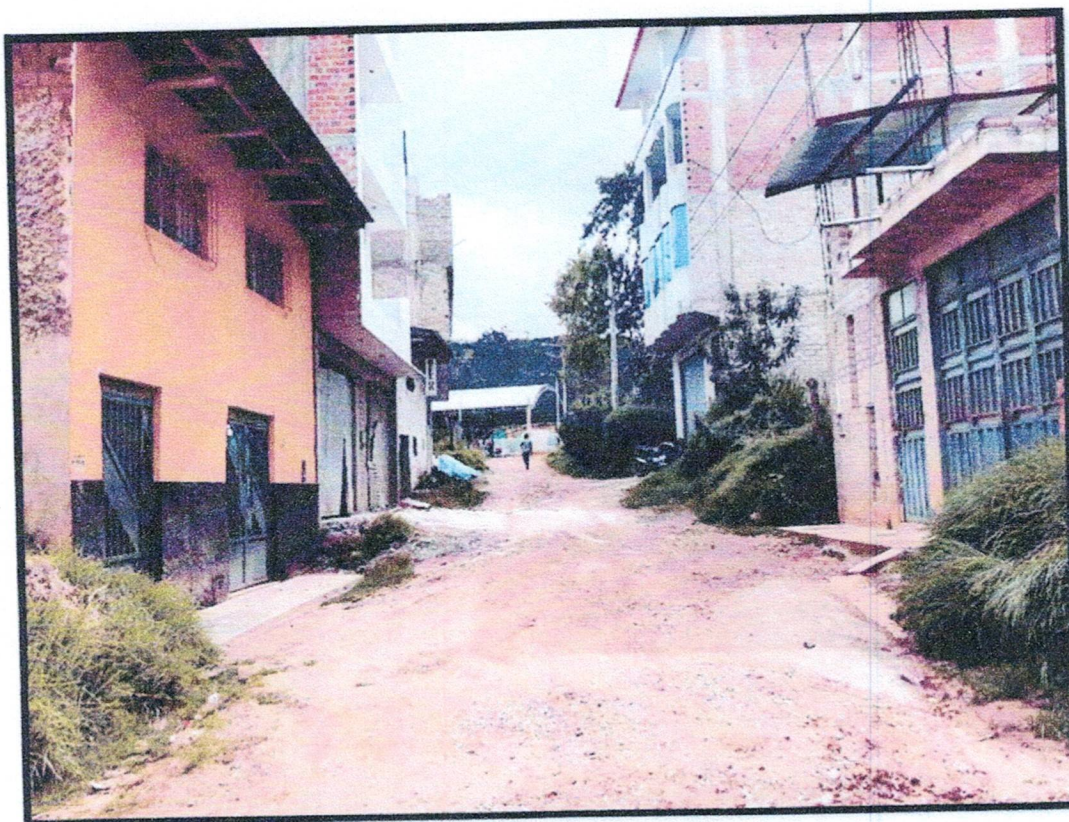
FOTO N°03 Vista fotográfica del Vista del Jr. La Esperanza, donde se aprecia que la vía se encuentra en terreno natural con material de afirmado en inadecuadas condiciones y no cuenta con veredas.