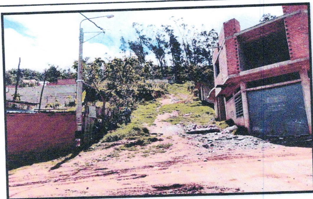
FOTO N°02 Vista fotográfica del Pasaje Tupac Amaru, donde se aprecia que la vía se encuentra en terreno natural, muro de contención y graderías a construirse