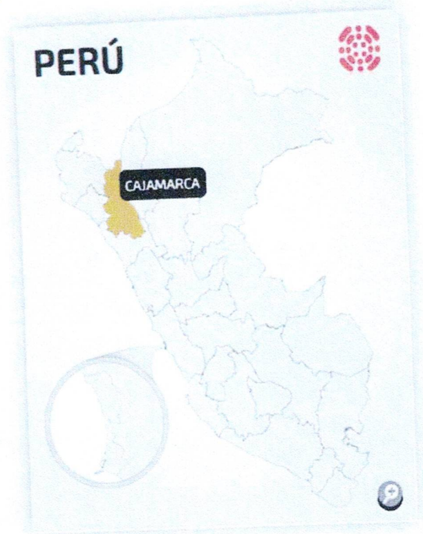
Figura N° A2: Ubicación Geográfica: Provincia de Cutervo