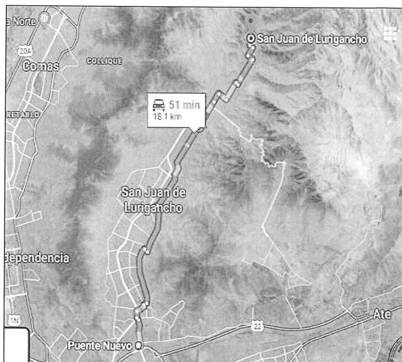
Imagen 1: Ubicación del proyecto en el Distrito de San Juan de Lurigancho.

SAN JUAN DE LURIGANCHO 001033 CAMBIA CONTIGO