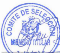
EDDES MILTON GUERRA ROJAS SUPLENTE MIEMBRO 1