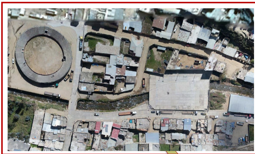
UBICACION DEL PROYECTO