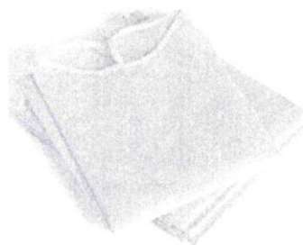
Fig. 1 (No incluye diseño)