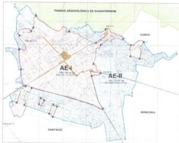
Ámbito de Estudio: AREA DE ESTRUCTURACION - I CENTRO HISTORICO (AE-I) APROX. 250 Ha., Centro Histórico del Cusco.