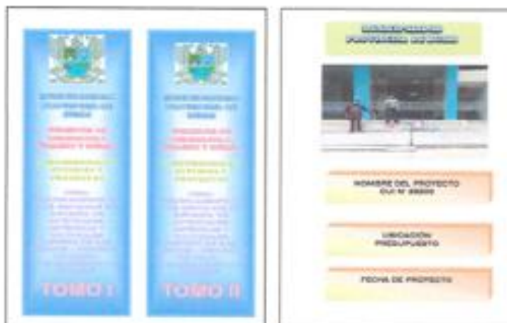
Figura 1. Forma de presentación del Expediente Técnico de obra:

Para elaborar y editar el Expediente Técnico se podrá utilizar los siguientes softwares: