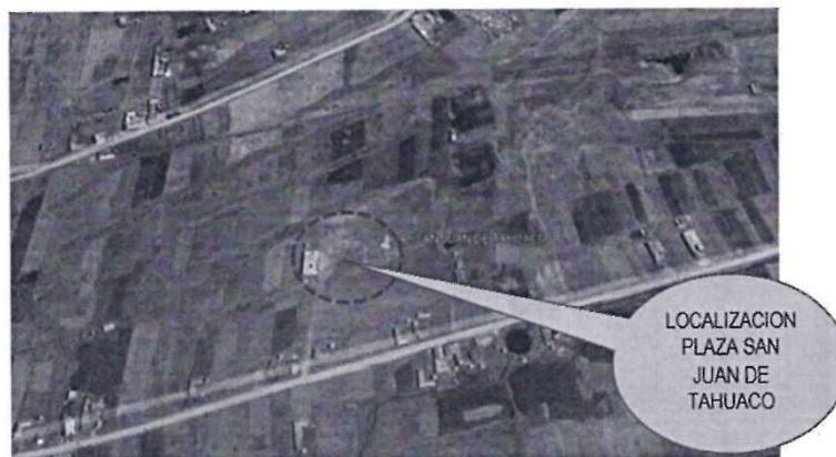
Imagen 02: Localización del Proyecto