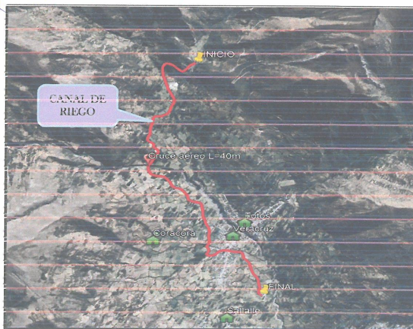
Figura 03: Imagen satelital de la ubicación del proyecto (canal de riego) – localidad de Veracruz