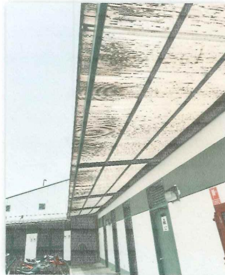
En la imagen tomada en Marzo de 2024, se puede apreciar el policarbonato dañado por las inclemencias del tiempo que serán reemplazados.