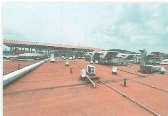
En la imagen tomada en Marzo de 2024, se puede apreciar el área en el que será construido la cobertura metálica, dando protección ante las inclemencias del tiempo a la estructura principal del Centro de Salud.