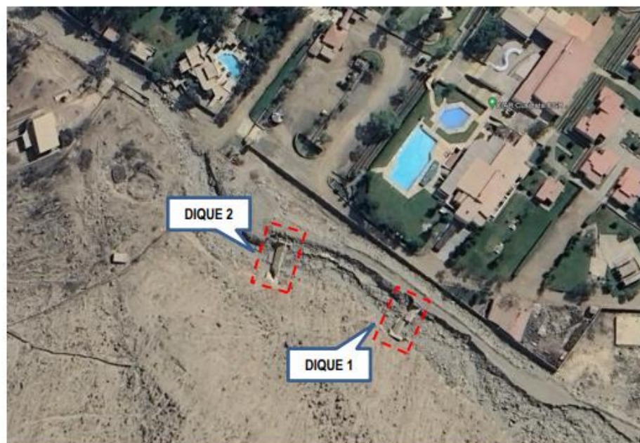
Figura 1. Ubicación de diques en la Quebrada Cusipata.

Mediante Decreto Supremo N° 110-2023-PCM, publicado el 02 de octubre de 2023, se prorroga el Estado de Emergencia en varios distritos de algunas provincias de los departamentos de Amazonas, Áncash, Arequipa, Ayacucho, Cajamarca, Huancavelica, Huánuco, Ica, Junín, La Libertad, Lambayeque, Lima, Moquegua, Pasco, Piura, San Martín, Tacna y Tumbes, por peligro inminente ante intensas precipitaciones pluviales (período 2023-2024) y posible Fenómeno El Niño, declarado mediante el Decreto Supremo N° 072-2023-PCM y prorrogado por el Decreto Supremo N° 089-2023-PCM, por el término de sesenta (60) días calendario, a partir del 7 de octubre de 2023, con la finalidad de continuar con la ejecución de medidas y acciones de excepción, inmediatas y necesarias de reducción del Muy Alto Riesgo existente, así como de respuesta y rehabilitación que correspondan.