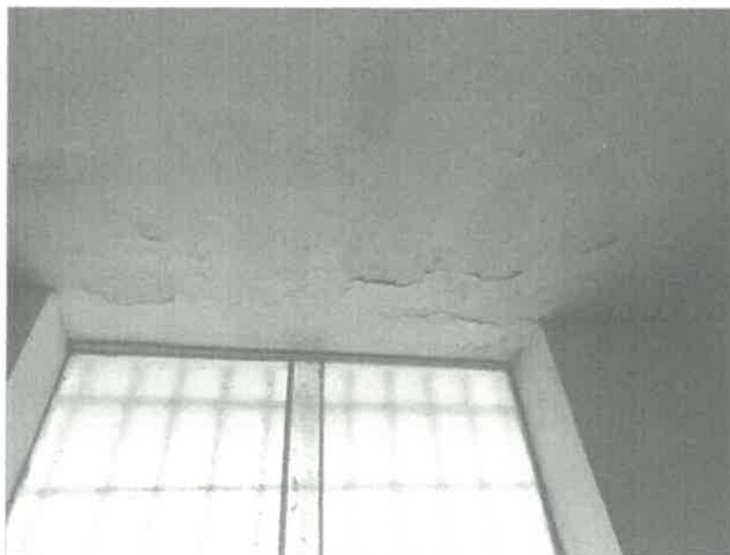
TECHOS CON PRESENCIA DE HUMEDAD.

TÉRMINOS DE REFERENCIA DECRETO SUPREMO N° 029-2023-SA - DECLARATORIA DE EMERGENCIA SANITARIA