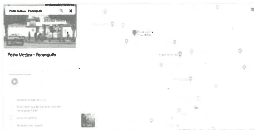
Plano de Ubicación geo localizado.