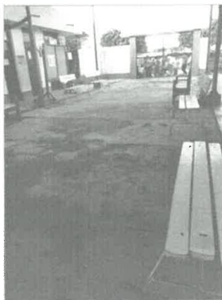
CENTRO DE SALUD PACANGUILLA DESPUES DE LAS INTENSAS LLUVIAS