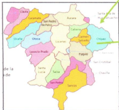
DISTRITO DE CHIPAO