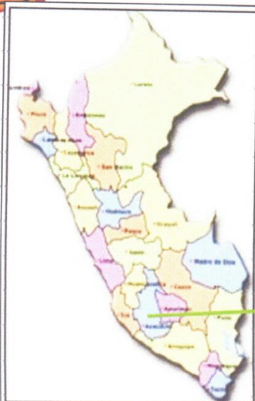
MAPA POLITICO DEL PERU