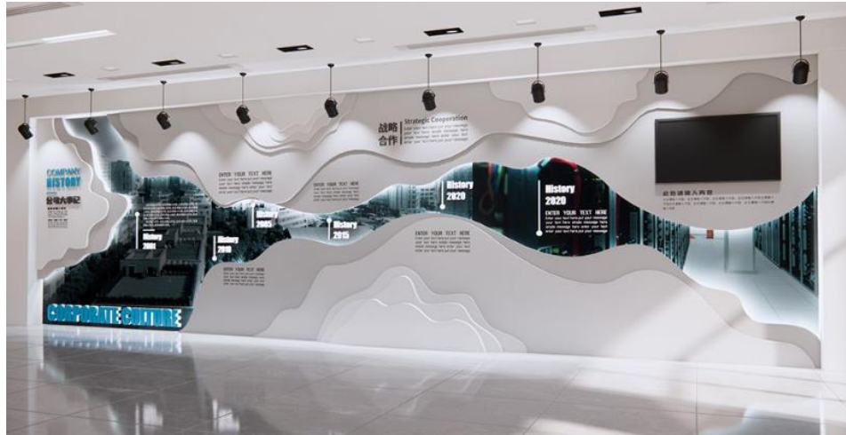
Imagen referencial de lo requerido

Fecha de montaje: 12 de diciembre, 2024 / Horario: 08:00am - 16:00pm