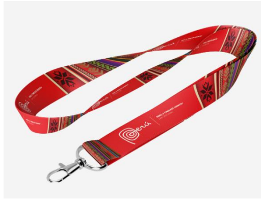
Imagen referencial de lo requerido