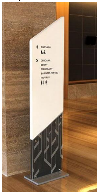
Imagen referencial de lo requerido