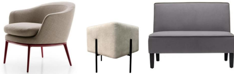
Imágenes referenciales de lo requerido