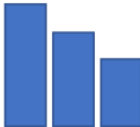
Imagen referencial de lo requerido