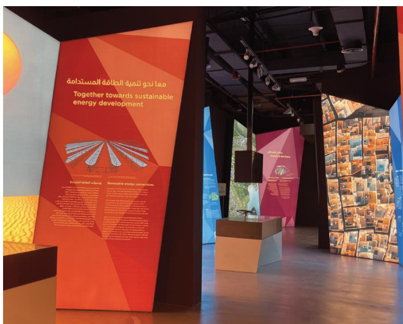
Imagen referencial de lo requerido