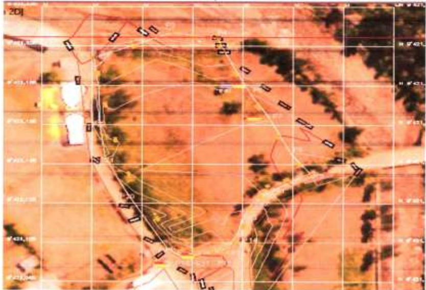
Fig. N° 5.- Área de influencia de la actividad

El área de influencia a intervenir de la IE AGROPECUARIO N°13- Huancabamba de la MANTENIMIENTO DE LA INFRAESTRUCTURA DEPORTIVA EN LA INSTITUCIÓN EDUCATIVA AGROPECUARIO N°13, DISTRITO Y PROVINCIA DE HUANCABAMBA, DEPARTAMENTO DE PIURA es de 4408 m. Aproximadamente.