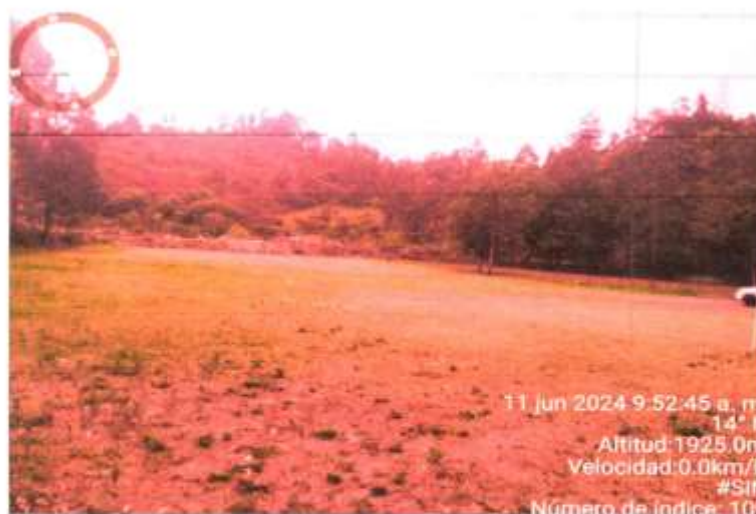
Fig. N° 4.- Se aprecia estado del campo deportivo Agropecuario N° 13.