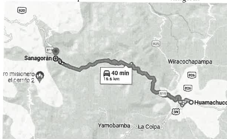
Croquis N° 01 ruta Huamachuco - Sanagorán