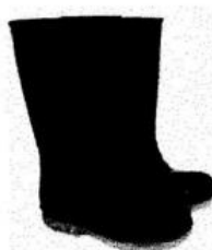
Botas de Jefe