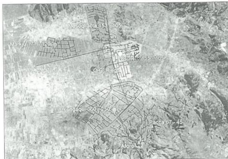
Ilustración 1: Sectores del Sistema de Riego

El proyecto consiste en el aprovechamiento de las aguas provenientes de la presa Yungaqui ubicada en el sector del mismo nombre, que captará un caudal total requerido de 97.50 l/seg para irrigar un total de 625.00 ha.