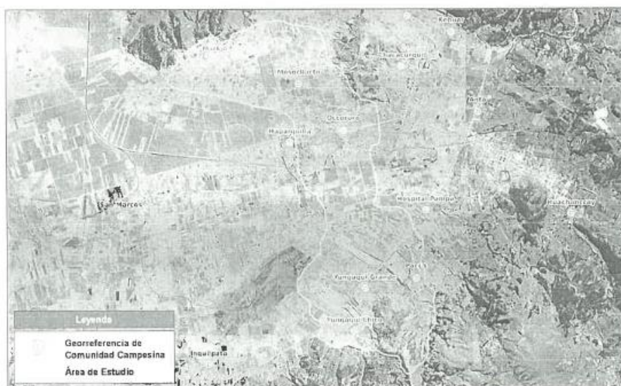
Figura N° 02: Área de estudio del proyecto – Comunidades Campesinas de Yungaqui, Pacca, Occoruro, Mosocllacta y Markjo

MUNICIPALIDAD PROVINCIAL DE ANTA Ing. Airalvi Ruffin Loaiza GERENTE DE ESTUDIOS Y PROYEC