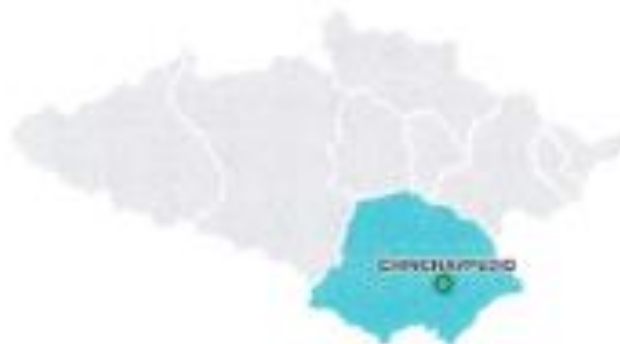
Districtos de la provincia de Anta

CONTRATACION SERVICIO DE CONSULTORIA PARA LA ELABORACION DE ESTUDIO DE PRE INVERSION A NIVEL DE FICHA TECNICA DEL PROYECTO "MEJORAMIENTO Y AMPLIACION DEL SISTEMA DE RIEGO TECNIFICADO PARA LAS COMUNIDADES DE CHINCHAYPUJIO, ANANSAYA Y HUAMBOMAYO DEL DISTRITO DE CHINCHAYPUJIO DE LA PROVINCIA DE ANTA - CUSCO", SEGÚN TERMINOS DE REFERENCIA, PARA LA META: 046.