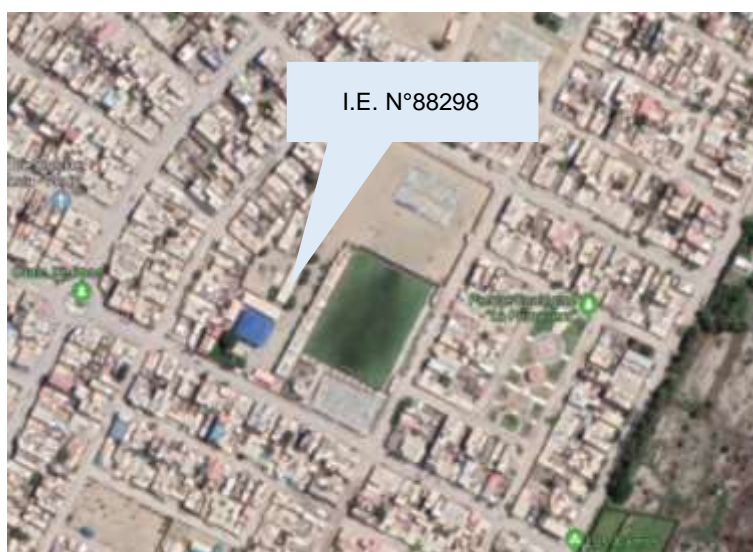
Grafico N° 01: Provincia de Santa, Distrito de Nuevo Chimbote, H.U.P. David Dasso Hock, Mz-E, Lt-01, Etapa II

Región : Ancash Departamento : Ancash Provincia : Santa Distrito : Nuevo Chimbote