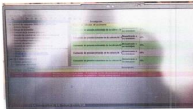
Foto N°12 Se requiere un mantenimiento para la reprogramación de motor y calibración de todos los componentes de la máquina.

Foto N°11 Chapa de contacto en mal estado, falta un gancho de seguridad de capot del motor.