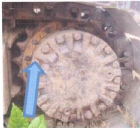
Foto N°07 Perno de Sprocket.