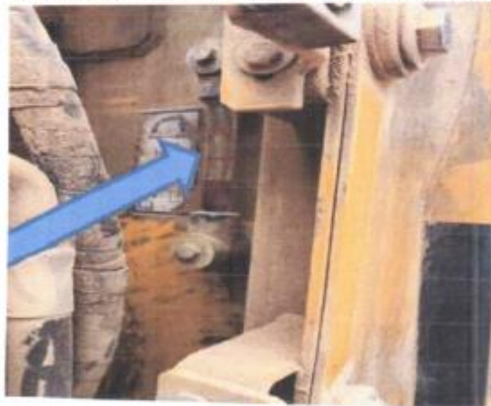
Foto N°13 Se requiere un cambio de aceite debido a que esta por debajo del nivel mínimo.

Foto N°12 Se requiere un mantenimiento para la reprogramación de motor y calibración de todos los componentes de la máquina.