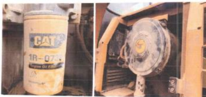
Foto N°10 Se requiere un cambio de aceite de motor y filtros de combustible, aceite y aire.