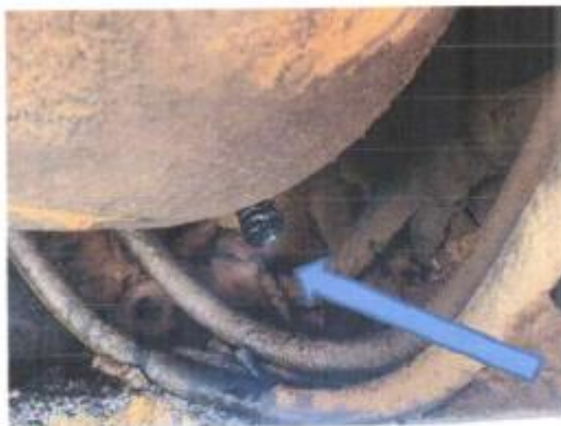
Foto N°10 Presencia de gases en el tubo de desfogue del motor.