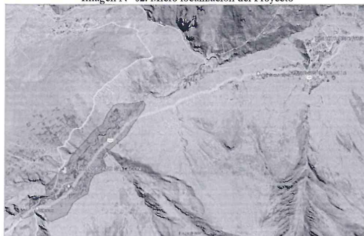
Imagen N° 02: Micro localización del Proyecto

En área de influencia del proyecto abarca la el Centro Poblado de Sallaconi, quienes se beneficiarán con el proyecto.