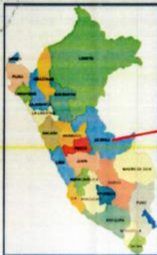
MAPA 01: MACROLOCALIZACIÓN DEL PROYECTO