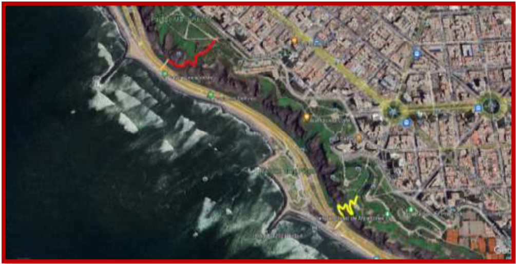
Tabla 2: Escaleras De Acceso