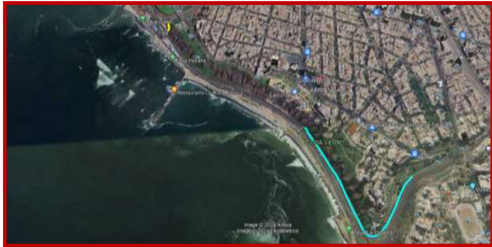
Tabla 3: Escaleras De Acceso