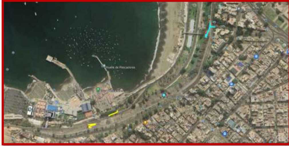
Tabla 5: Escaleras De Acceso