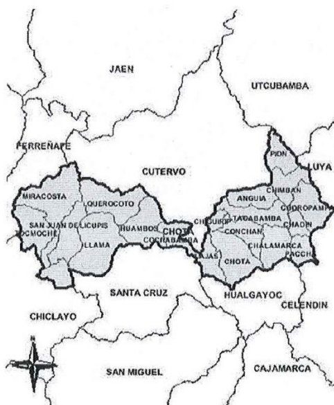
MAPA N° 03. Ubicación geográfica del distrito de Chota