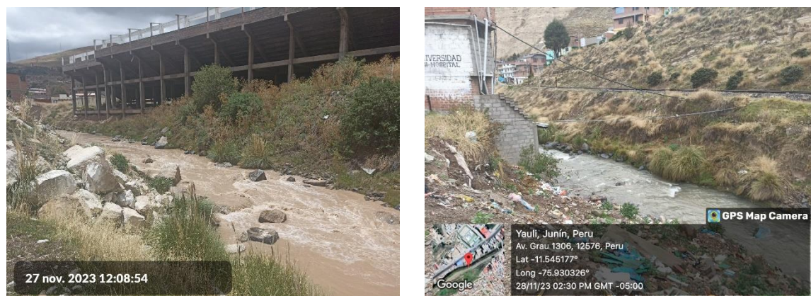
Imagen 2: Ubicación del terreno para la obra