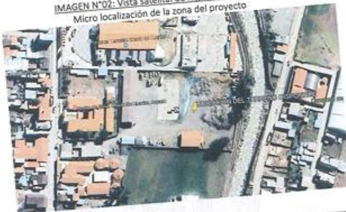
IMAGEN N°02: Vista satelital de lugar a intervenir Micro localización de la zona del proyecto