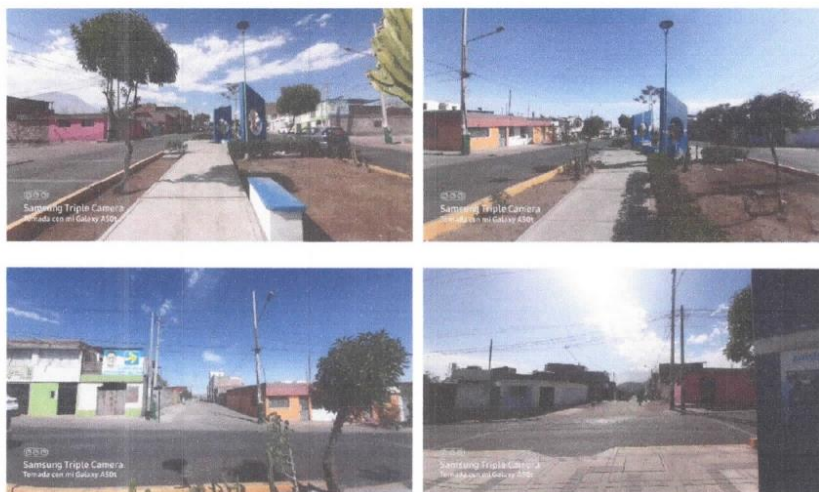
Vista de Intersección (AV. MIGUEL GRAU Y SANTA CLARA) PROGRESIVA - 0+280