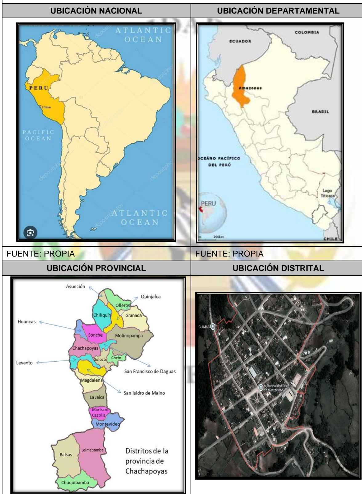
MAPA N°01: UBICACIÓN DE LA INFRAESTRUCTURA

En la siguiente lámina se presenta, el esquema de localización del proyecto: