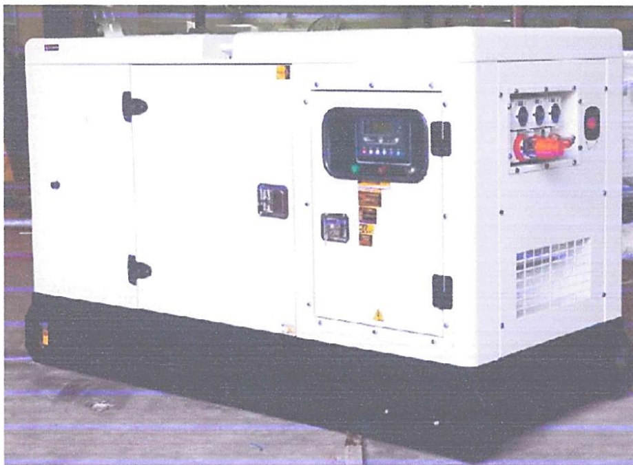
Imagen referencial del GGEE