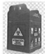
CUADRO 14: ESPECIFICACIONES DE LOS RECIPIENTES PARA RESIDUOS PUNZOCORTANTE BIOCONTAMINADOS