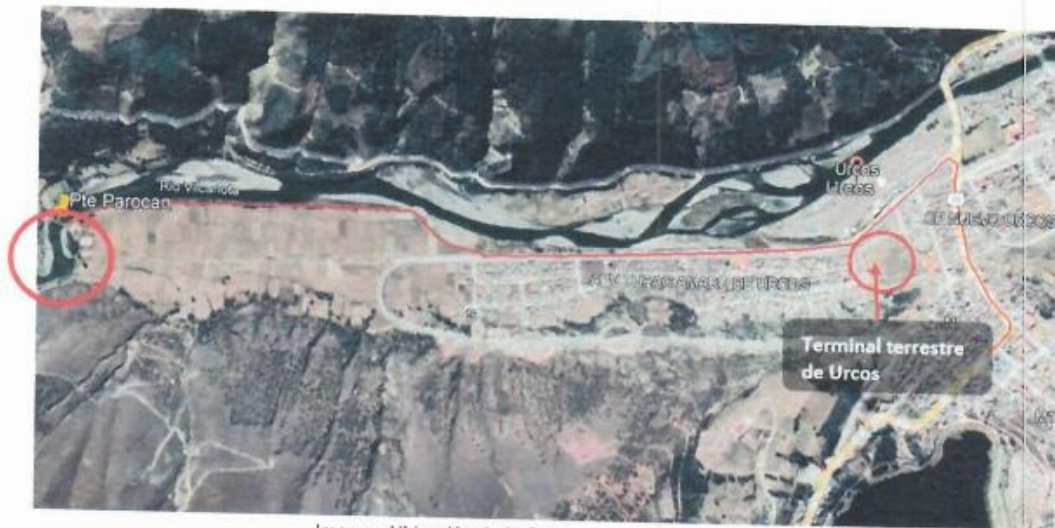
Imagen: Ubicación de la Obra.

La entrega del material agregado se realizará en coordinación con el Residente de Obra en el almacén de la obra: "MEJORAMIENTO DEL PUENTE CARROZABLE SOBRE EL RIO VILCANOTA EN LA COMUNIDAD DE PAROCCAN DISTRITO DE URCOS - PROVINCIA QUISPICANCHI - DEPARTAMENTO DE CUSCO".