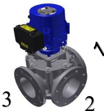
Imagen referencial: posición cerrado pasa del 1 al 3, posición abierta pasa del 1 al 2