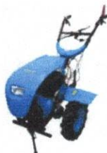
IMPAC PERÚ S.A.C. Motocultivador 12 hp die...