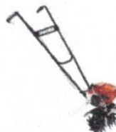
Nogaipark MOTOCULTIVADOR EC...