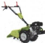
Eberlein Motocultivador Grillo G4...