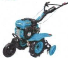
Total Herramientas Motocultivadora a Explosi...