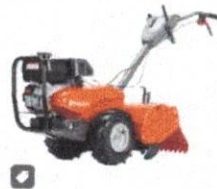
MOLAMAQ Motocultivador Husqvarn...