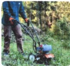
Van Beek ¿Que es un motocultiv...