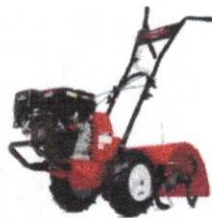
De Máquinas y Herramientas - De M... Motocultivador, pros y contras | D...