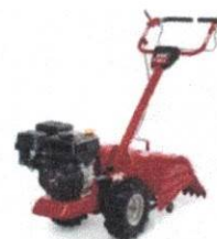
De Máquinas y Herramientas - De Máq... Motocultivador, pros y contras | De ...

En relación con ello, en el numeral 16.2 del artículo 16 de la Ley, se estipula que las especificaciones técnicas, términos de referencia o expediente técnico que finalmente forman parte de las bases integradas deben formularse de forma objetiva y precisa por el área usuaria.