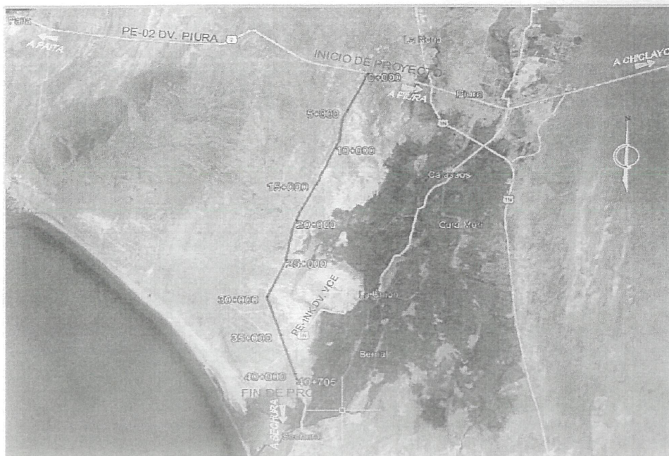
Imagen 01: Vista Satelital de la extensión total del proyecto: Mejoramiento de la Ruta Departamental PI-127.