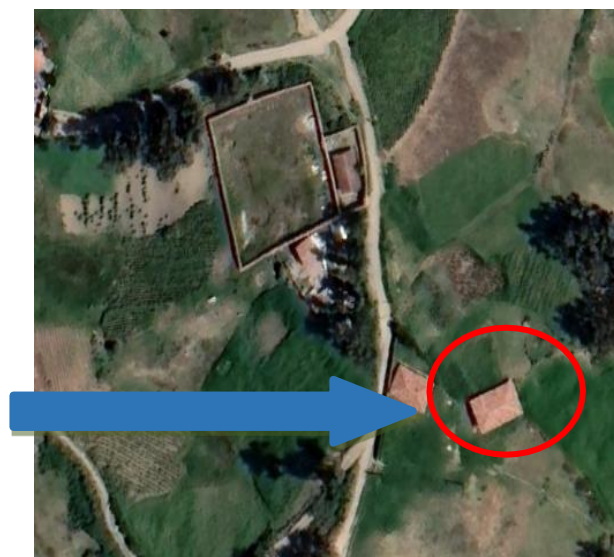
Mapa 03: Ubicación del Distrito de Chavín de Huántar del Caserío de Rahua