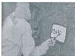
Imagen referencial N°01

Se pintará las progresivas de fondo color blanco, letras color negro, y escritura de la siguiente manera por ejemplo 02+300.