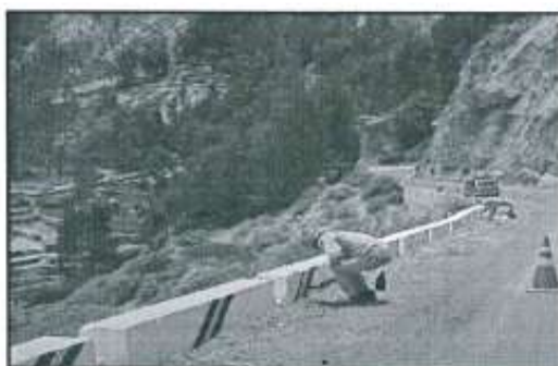
Imagen referencial N°04

Fondo blanco y líneas de color negro y amarillo, y progresiva de ubicación.