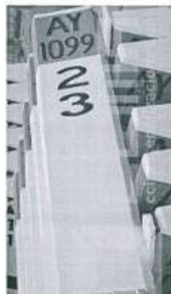
Imagen referencial N°02

Se pintará las progresivas de fondo color blanco, letras color negro, y escritura de la siguiente manera por ejemplo 02+300.