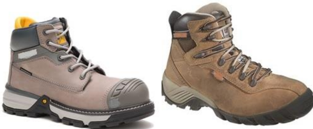
Imagen Referencial Ítem requiere muestra y ficha técnica

"El ítem requiere la presentación de muestra y ficha técnica".