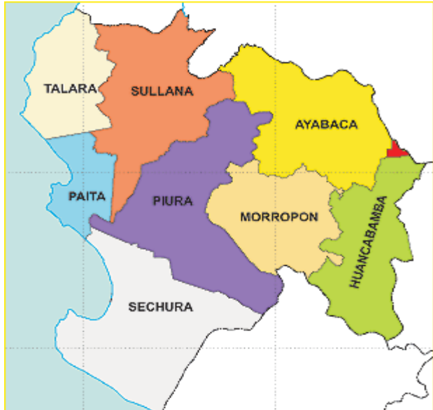
GRAFICA 02: UBICACIÓN A NIVEL DEPARTAMENTAL