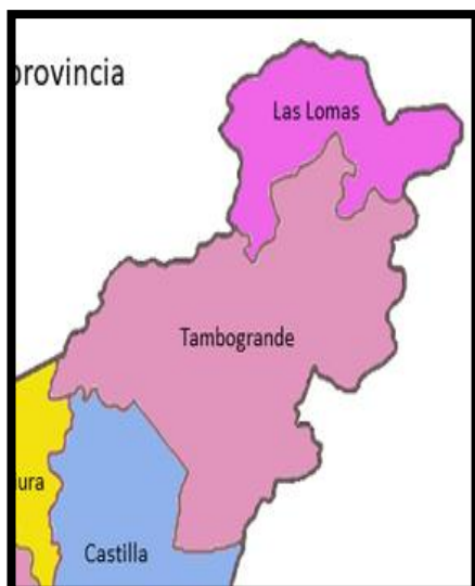
GRAFICA 03: UBICACIÓN A NIVEL DISTRITAL