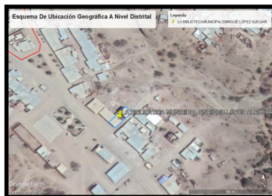
GRAFICA 04: UBICACIÓN DEL PROYECTO