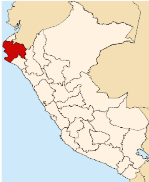
GRAFICA 01: UBICACIÓN A NIVEL NACIONAL

Por el Oeste: Con el Distrito de Piura y Castilla