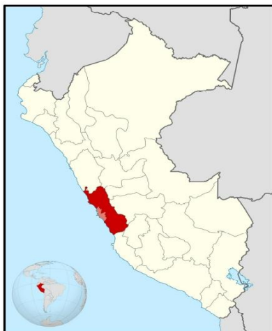
UBICACIÓN GEOGRÁFICA DEL DEPARTAMENTO DE LIMA

Región : Lima Departamento : Lima Provincia : Lima Distrito : Lince