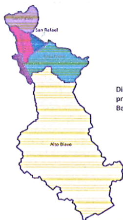
Distritos de la provincia de Bellavista