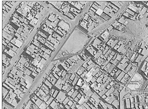
Imagen 1: Ubicación del proyecto en el Distrito de San Juan de Lurigancho.